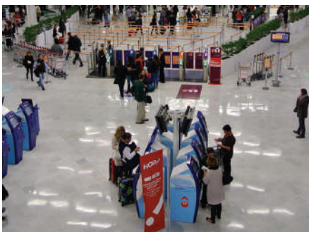
Hall d'Orly - France