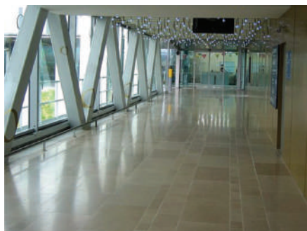
Gare de TGV Lorraine - Louvigny - France